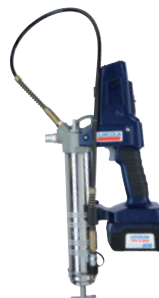
PowerLuber de iones de litio de 18 V Modelo 1862-E