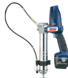
PowerLuber de NiCad de 18 V Modelo 1842-E