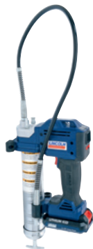
PowerLuber de iones de litio de 20 V Modelo 1882-E

La familia PowerLuber de Lincoln incluye toda una gama de pistolas de engrase operadas con batería e incluye herramientas impulsadas por NiCad e iones de litio, así como opciones neumáticas y eléctricas. Desarrollada por expertos en lubricación, la gama PowerLuber tiene la pistola de engrase adecuada para sus necesidades.