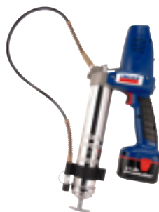
PowerLuber de 14 V Modelo 1442-E