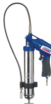
PowerLuber neumática Modelo 1162-E